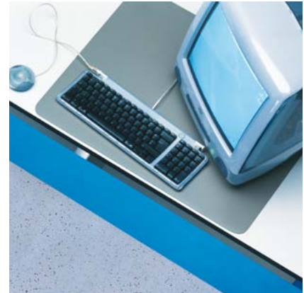
Antistatik-Tischmatten Serie 20 komplett mit Erdungsbaustein

Rollstat®-Antistatikmatten gibt es für Hart- und Niederflorböden. Grau/Schwarz marmoriert für Parkett, Stein- und Niederflor-Teppichböden. Mattenstärke: 2,5 mm