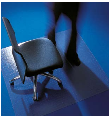
Ecogrip® Serie 11 mit Ankernoppen

Ecogrip® wird aus Makrolon® gefertigt. Dieser hochwertige Werkstoff ist absolut schlag- und bruchfest und gewährleistet eine außergewöhnlich lange Nutzungsdauer. Außerdem ist Makrolon® zu 100 % recyclebar und bewirkt somit auch einen sparsamen Umgang mit allen zur Herstellung notwendigen Ressourcen.