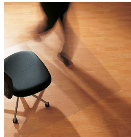
Ecogrip® Serie 12 mit Haftschrift

Bei Teppichen und Teppichböden helfen stumpfe Ankernoppen gegen das Verrutschen der Matten. Diese Serie wird bei hochflorigen Teppichen empfohlen. Mattenstärke: 1,8 mm, Noppenlänge: 4,5 mm.