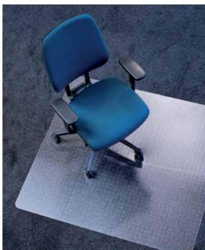
Ecoblue® Serie 07 mit Ankernoppen

Die transparente Bodenschutzmatte aus umweltfreundlichen PET kann nach dem Gebrauch sogar mehrmals recycelt werden: Das schont die Umwelt und spart Energie – ein weiteres Plus für die Ecoblue® Bodenschutzmatte aus dem Hause RS Office Products.