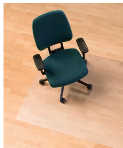
Ecoblue® Serie 08 mit Haftschrift

Mattenstärke: 2,1 mm, Noppenlänge: ca. 2,1 mm.