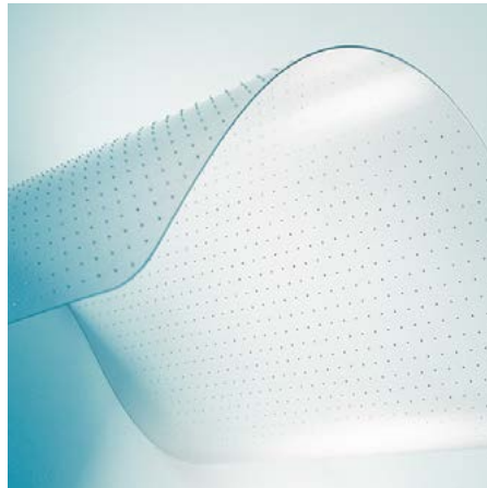
Für Teppichböden mit Ankernoppen