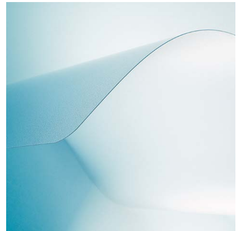
Für Hartböden mit VAB®-Haftschrift